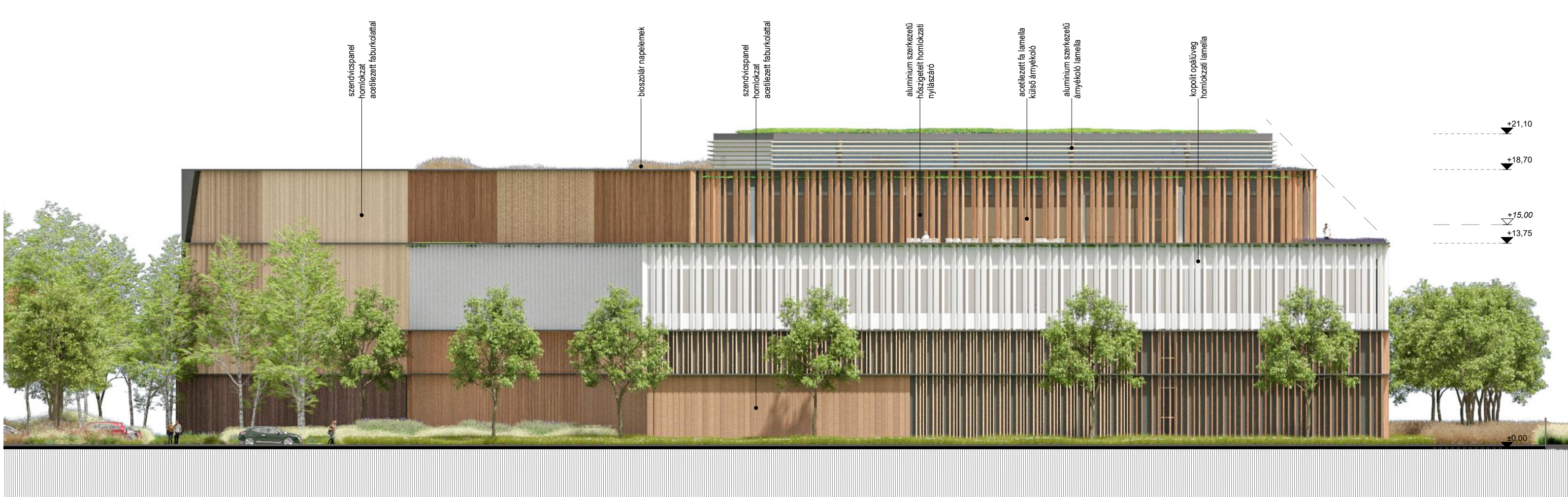
déli homlokzat 1:250