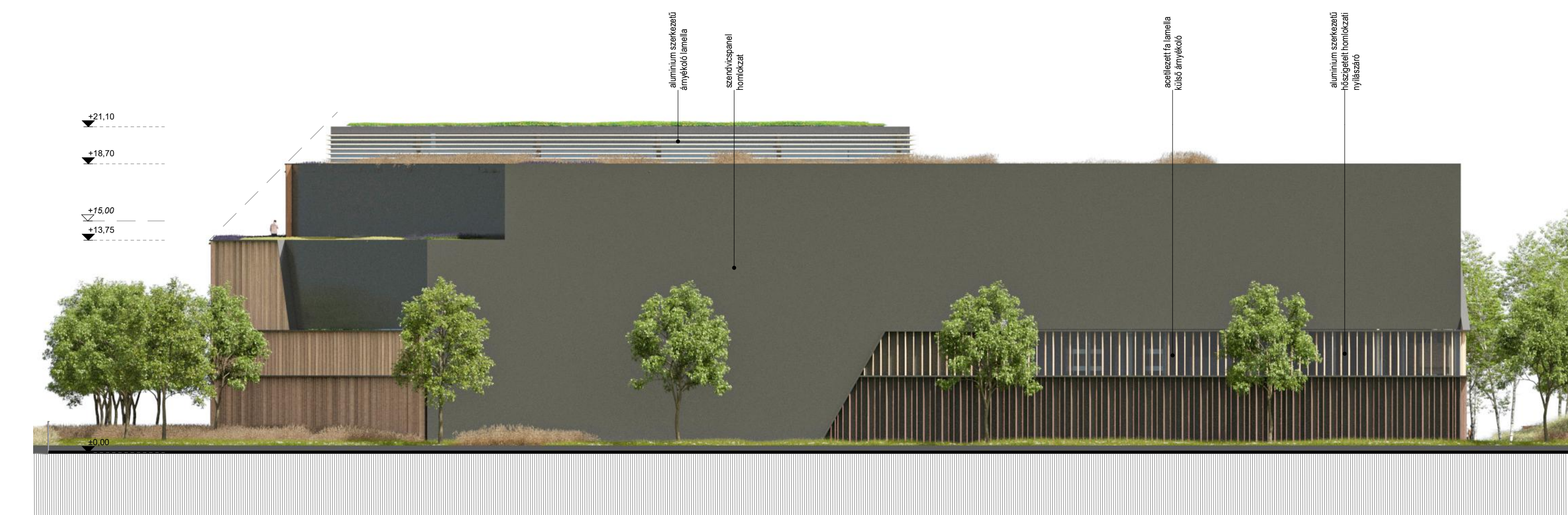
északi homlokzat 1:250

földfelszíni nézőpont a tervezési terület déli-nyugati sarokpontjából